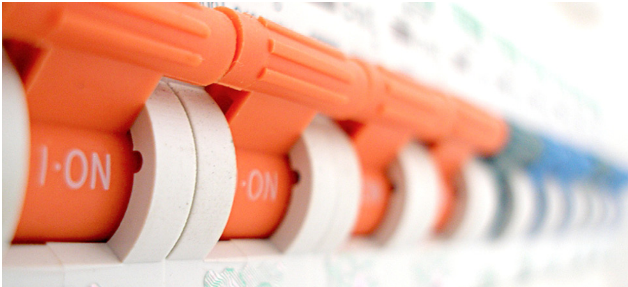
I endring: Elektrofaget trues av sosial dumping og svekkede rettigheter.