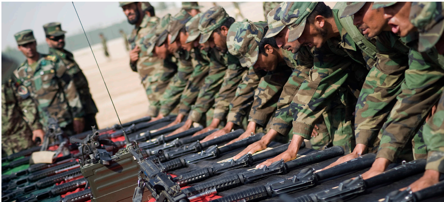
Våpnene florerer: En tredjedel av amerikanernes våpen i Afghanistan er på avveie.